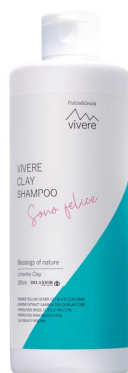
VIVERE クレイシャンプー 300mL

リモナイト(黄土)は、熊本県阿蘇山のカルデラから採掘された自然の恵み。温泉施設などでは、リモナイトで作られたタイルが使われています。このタイルが放つのは、遠赤外線効果。体を温め、巡りをよくし、老廃物や皮脂などの排出を促すことが知られています。いにしえから阿蘇黄土は自然の恵み、いのちの土として愛され続けています。