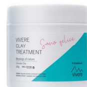
VIVERE クレイトリートメント 200g