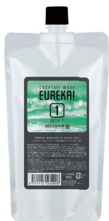
カクテルウェーブ エウレカ ソフト