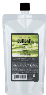
カクテルウェーブ エウレカ ハード

健康毛からライトダメージ毛に対してリッジのあるウェーブを再現できるシステイン系パーマ剤。