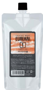
カクテルウェーブ エウレカ ミディアム

ライトダメージ毛からミドルダメージ毛に対して幅広く対応できるシステイン系パーマ剤。