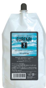
カクテルウェーブ エウレカ セカンドローション オキシC/T