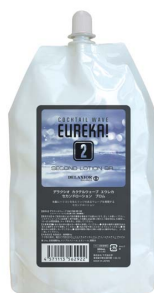
カクテルウェーブ エウレカ セカンドローション ブロムC/T