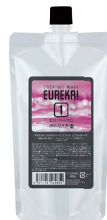
カクテルウェーブ エウレカ エクストラハード